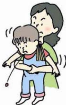
図 3 ハイムリッヒ法 (年長児)

大人や年長児では、後ろから両腕を回し、みぞおちの下で片方の手を握り拳にして、腹部を上方へ圧迫します (図 3)。この方法が行えない場合、横向きに寝かせて、または、座って前かがみにして背部叩打法を試みます。