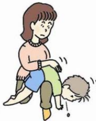
図 2 背部叩打法変法 (少し大きい子)