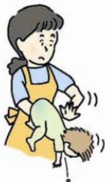
図 1 背部叩打法 (乳児)

乳幼児では、口の中に指を入れずに、乳児は片腕にうつ伏せに乗せ顔を支えて (図 1)、また、少し大きい子は立て膝で太ももがうつ伏せにした子のみぞおちを圧迫するようにして (図 2)、どちらも頭を低くして、背中の中を平手で何度も連続して叩きます。なお、腹部臓器を傷付けないよう力を加減します。